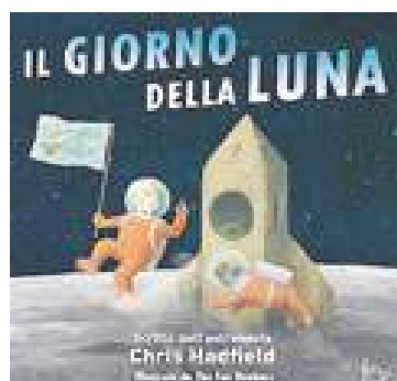
"Il giorno della Luna" di Chris Hadfield (Il Castoro)