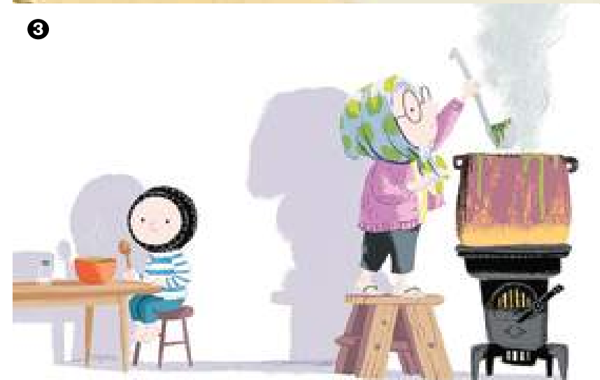
1. Marco Somà illustra "L'infinito" di Leopardi (Einaudi Ragazzi) 2. Illustrazione di Alejandra Estrada per "Nina e Teo" (Kalandraka) 3. Benji Davies, "Un'estate dalla nonna" (Giralangolo)